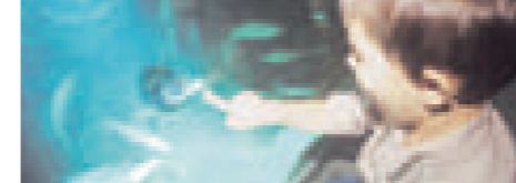
Sea Life Konstanz