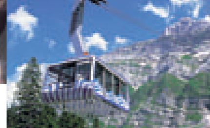
Säntisgipfel im Appenzeller Land